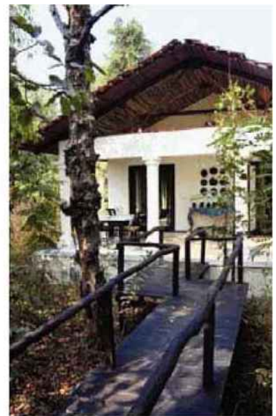
Traditionnel. L'un des bungalows du lodge Baghvan, situé en bordure de la rivière Pench, à deux pas du parc.