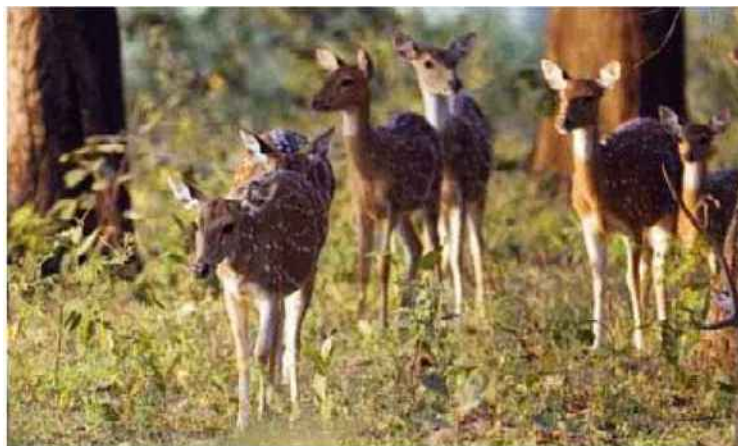
Grâce. Troupeau de daims traversant le parc de Kanha.