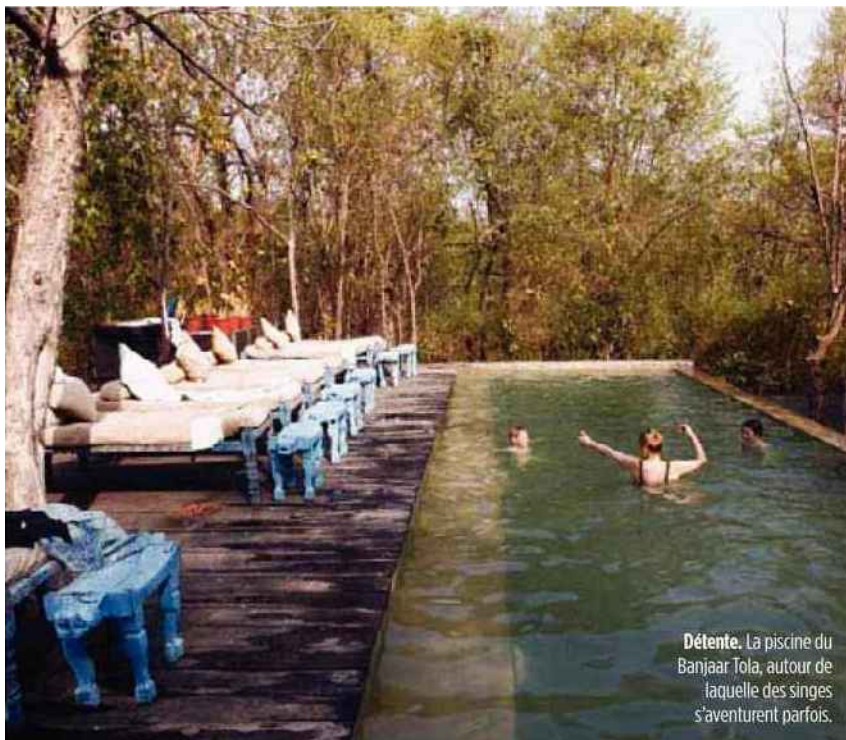
Détente. La piscine du Banjar Tola, autour de laquelle des singes s'aventurent parfois.